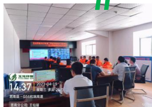
思南分公司线上学习