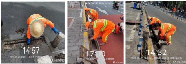
(上图：清掏水篦子，进行深度清洁)