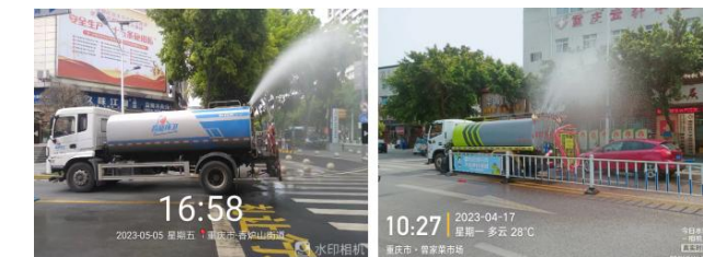
(上图：除尘降尘，清新空气)