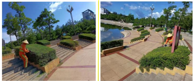
(上图：艺术化的园艺，艺术化的园林)