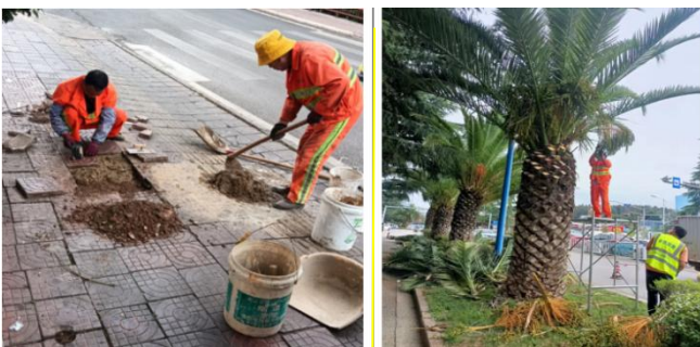
(上图：修树、修路、修城市坦途生活)