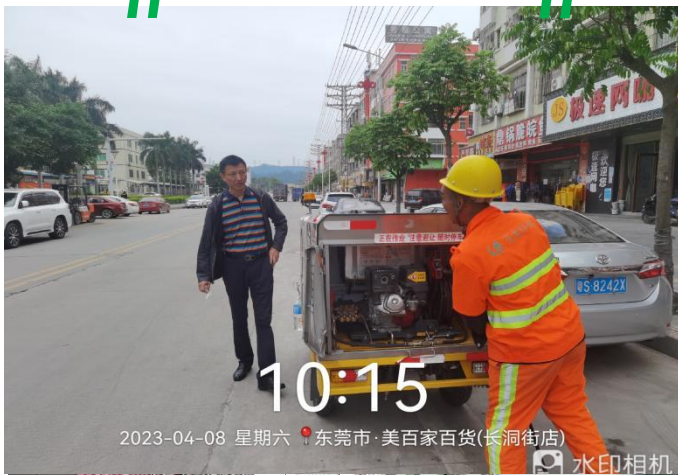
2023-04-08 星期六 东莞市·美百家百货(长洞街店)