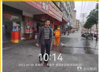
2023-04-08 星期六 东莞市·美百家百货(长洞街店)