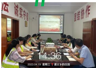
遵义玉龙环保线上学习