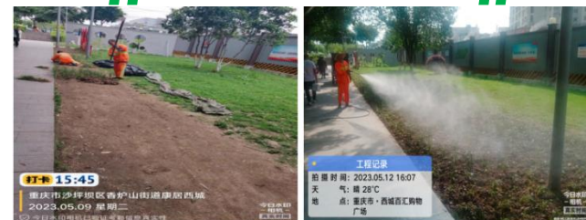
(上图：绿化栽裁，美化环境)