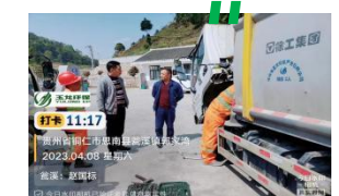
贵州省铜仁市思南县深溪镇古井 2023.04.08 星期六