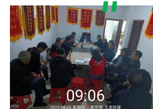
翻阳分公司组织培训