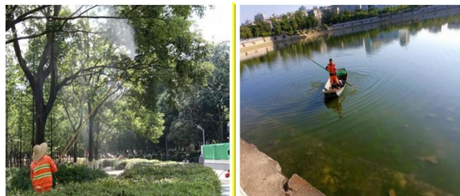
(上图：护林、护水、护城市美好的环境)