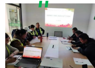
重庆分公司组织培训