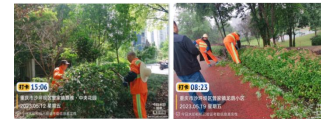
(上图：灌木修剪，美轮美奂)