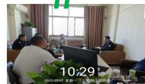
2023-05-01 星期一 上海市·玉龙环保

5月1日，鄱阳县交警队事故科科员利用假期时间，到玉龙环保鄱阳分公司做交通安全教育宣传，给分公司管理团队宣讲交通安全规章和交通事故案例分析。