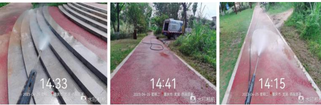
(上图：精细化作业，对路面深度保洁)