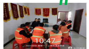
2023-05-01 星期一 上海市·玉龙环保