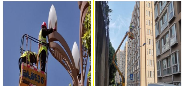
(上图：路灯检查维修，灼灼光芒照亮路人)