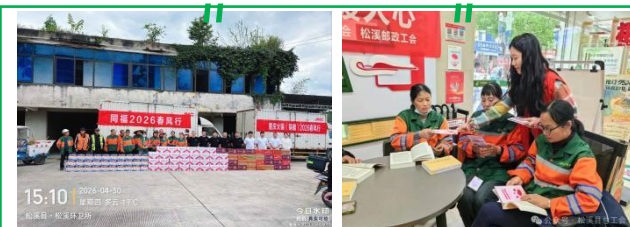
松溪分公司：爱心企业慰问环卫工人、工会驿站庆五一志愿服务活动

此次荣获殊荣的 10 名员工，是服务民生一线的优秀代表。他们用辛勤付出诠释了“劳动最光荣”的真谛，展现了新时代劳动者的风采。这一荣誉不仅是对他们个人的肯定，更是对喀什玉龙环保践行社会责任、关爱员工发展的认可。