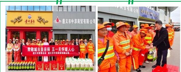
遵义玉龙环保：慈善总会、爱心企业关怀环卫工人，发放慰问品